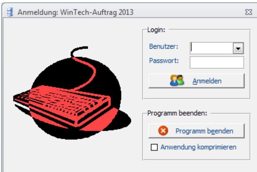
Bild1: Der Anmeldedialog von WinTech-Auftrag 2021

Starten Sie das Access Programm <WinTech-Auftrag 2021 Basis> bzw. <WinTech-Auftrag 2021 Premium> per Doppelclick auf die Datei „WinTech_Auftrag2021Basis.accde“ bzw. „WinTech_Auftrag2021Premium.accde“.