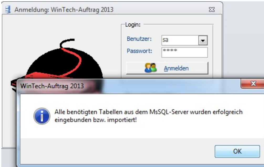
Bild3: Erfolgreiche Anmeldung am Ms SQL Server in WinTech-Auftrag2021.

Nach der Installation des MS SQL Servers gibt es einen USER „sa“, der auch in aller Regel ein Kennwort besitzt. (Das Kennwort, das Sie während der Installation des SQL Servers vergeben haben.)