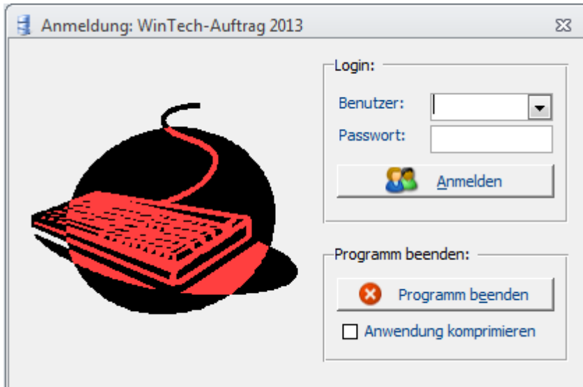
Bild1: Der Anmeldedialog von WinTech-Auftrag 2013