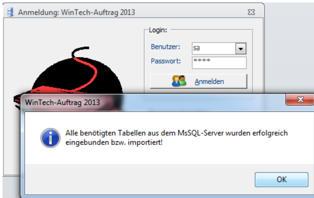
Bild3: Erfolgreiche Anmeldung am Ms SQL Server in WinTech-Auftrag2013.

Nach der Installation des MS SQL Servers gibt es einen USER „sa“, der auch in aller Regel ein Kennwort besitzt. (Das Kennwort, das Sie während der Installation des SQL Servers vergeben haben.)